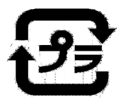
毎週水曜日の リサイクルゴミのマーク

また、水曜日のプラスチックごみの日にプラスチック製の鉢やプランターが廃棄されています。プラスチック製の鉢やプランターは、粗ゴミです。リサイクルゴミではありません。各商品の表示を確認していただき、正しい分別をお願いします。枚方市のホームページでもご確認いただけます。