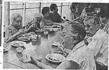
お年寄りを囲んで楽しく食事会